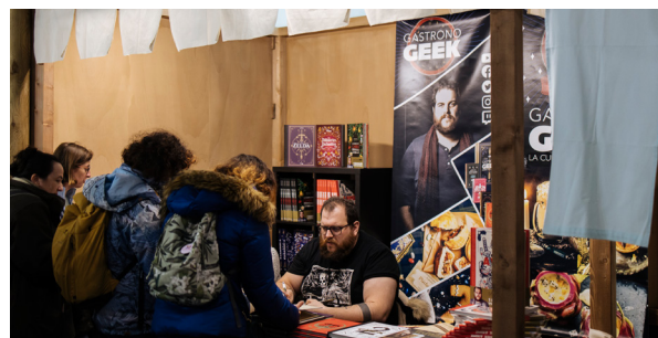
Stand 6 m 2 , sans angle